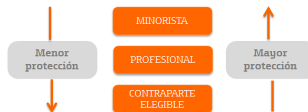
Grados de protección según Clasificación MiFID

Todo cliente persona física o jurídica puede solicitar en cualquier momento el cambio de su clasificación, lo que puede suponer que se le otorgue un mayor nivel de protección (por ejemplo, reclasificación de profesional a minorista) o un menor nivel de protección (por ejemplo, reclasificación de minorista a profesional).